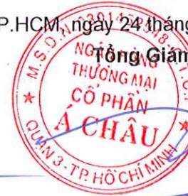
Từ Tiến Phát