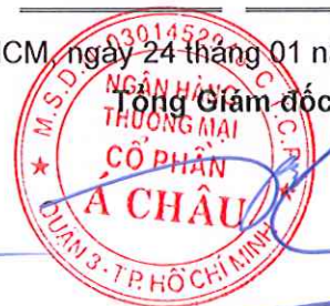
Từ Tiến Phát